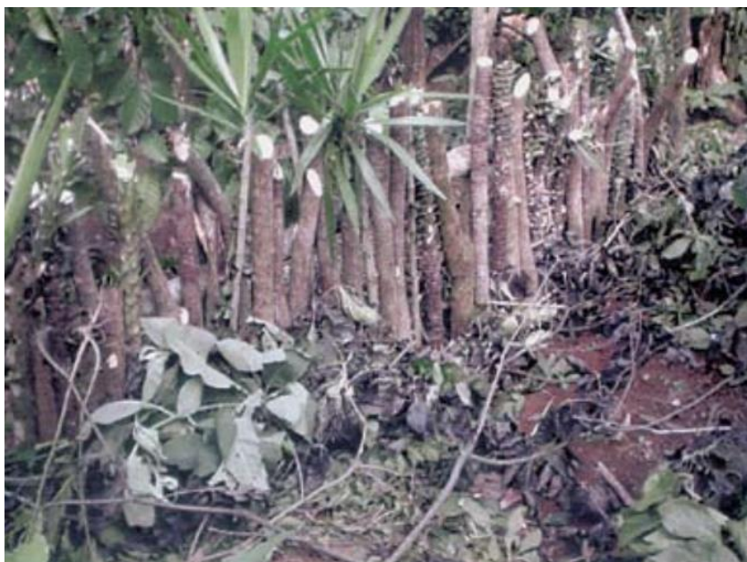
Presa filtrante vegetativa elaborada a base de yuca Municipio Cañaveral, Comunidad Chimore